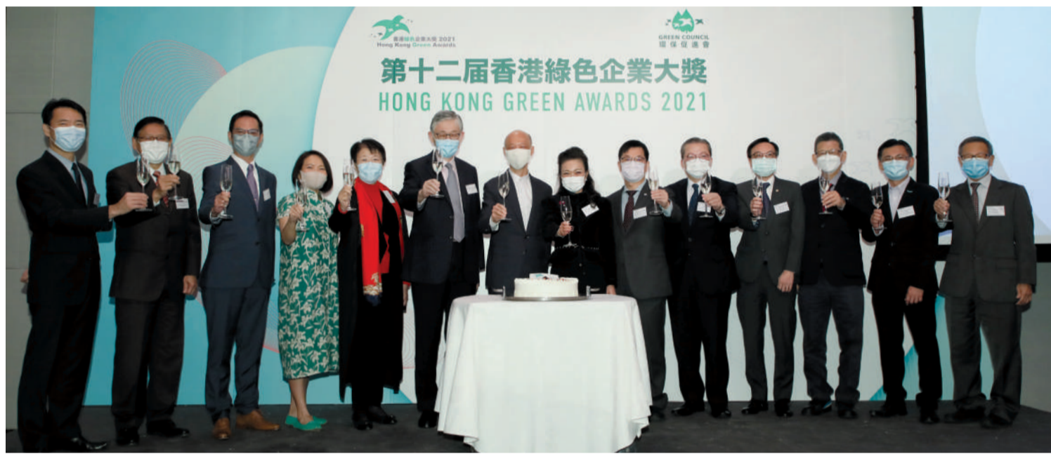
頒獎典禮主禮嘉賓環境局局長黃錦星先生、環保促進會執行委員會主席施永青先生、行政總幹事何惠萍女士及一眾嘉賓

何惠萍指「香港綠色企業大獎」由第一屆至今，得到會員及各界支持，實屬榮幸，也給予環保促進會團隊極大動力去持續推動有關工作。「汲取過去多年經驗，今屆大獎提交報告的過程已全面實行『無紙化』，而且在網絡安全方面更提升至另一高度，確保企業所提交的數據及資料得到保障。隨着大獎認受性愈來愈高，未來將會增設更多獎項，去鼓勵更多積極推動可持續發展的企業和機構，與我們並肩向公眾推廣相關教育。」