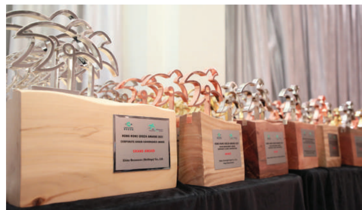
今年大獎獎座由環保社會企業——香港木庫所贊助，而且全部由颶風『山竹』造成塌樹的樹木材料所製成，極具意義及收藏價值

她亦特別提到今年的獎座由環保社會企業——香港木庫所贊助，而且極具收藏價值。「今年所有大獎獎座的底座全部由颶風『山竹』造成塌樹的樹木材料所製成，每座均會寫上颶風名字、樹木品種和『出產』地區，加上製作過程全由設計及加工，外型精美，意義更珍貴。」